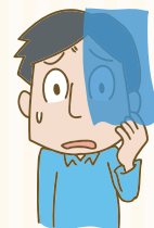
片目が見えづらい